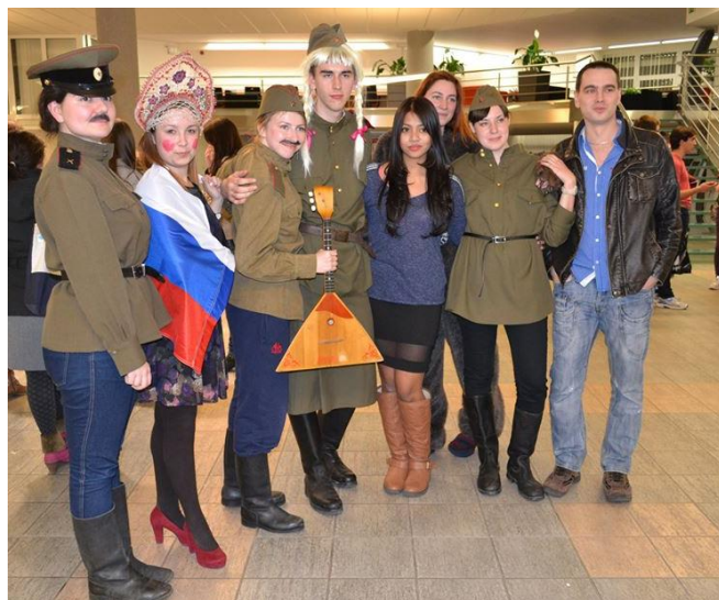
Представляли Россию на мероприятии Country Presentation

Порадовал и сам университет наличием удобных и технически оборудованных аудиторий, компетентных преподавателей, а также интересными курсами. Так, например, я записалась на курс “Cognitive hiking”, суть которого заключалась в посещении памятных мест и достопримечательностей в Брно и в его окрестностях. Мы ходили пешком по 10-15 километров каждую субботу и слушали про историю и культуру Южной Моравии (оказывается, в этом регионе произошло много всего значимого!). Кроме того, я закончила курсы чешского языка для продвинутых пользователей и сдала экзамены на отличные оценки.