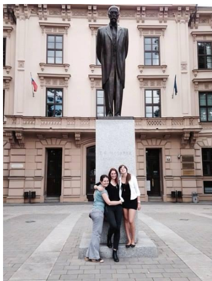
Главное здание университета (статуя вечно грустного Т. Масарика)

О программе Эразмус Мундус я узнала случайно: увидела объявления, расклеенные в коридоре университета, услышала от знакомых о такой возможности. Казалось, что это нереально – поехать на стажировку за границу, в другой вуз, да еще и бесплатно. Можно сказать, меня буквально уговорили подать заявку. Собрание бесконечных бумажек и подписей само по себе казалось утомительным и бесперспективным делом. Оказалось, что это не так уж и сложно!